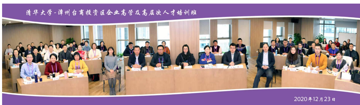
清华大学-漳州台商投资区企业高管及高层次人才培训班

5、加强专业技术人员继续教育，加大适用新型人才的培训力度，实施企业现有人才能力提升工程，有效提高各类员工素质。实行合理的人员岗位轮换和淘汰机制，经理以上人员实行择优、竞聘上岗制度的管理办法等。逐步形成能上能下、能进能出的人才流动和竞争机制，有效推进员工与公司齐发展，共享企业经营成果，提升员工工作积极性。2020 年除日常的上岗培训、操作规程培训、5S 培训、安全教育培训外，重点组织了企业管理人员前往北京清华大学继续教育学院参加为期 5 天的高层次人才培训。